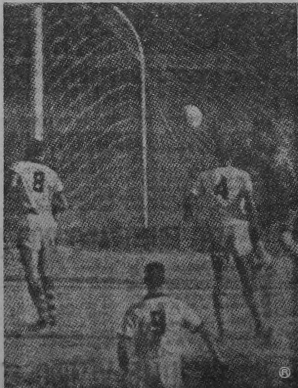
Esta escena corresponde al partido Uruguay-Alianza y en ella puede verse al delantero Sacone cuando remataba de cabeza fallando en su intento por anotar. Los ticos ganaron por tres goles a uno.

average se llevaron la cuadrangular siguiéndoles en su turno Atlas y Alianza.